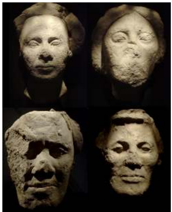
Abb. 5: Masken aus Amarna