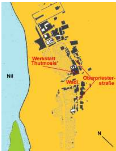
Abb. 2: Das Stadtgebiet von Amarna

Der Erman-Schüler Ludwig Borchardt, Ägyptologe und Architekt, war Direktor der 1907 im Auftrage des deutschen Kaisers in Kairo gegründeten wissenschaftlichen Einrichtung „Kaiserlich Deutsches Institut für Ägyptische Altertumskunde“, Vorläufer des späteren Deutschen Archäologi-