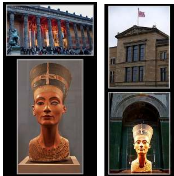
Abb. 10+11: Nofretete im Alten Museum (links) und im Neuen Museum (rechts)

Schließlich erfolgte auch die Überführung der Nofretete-Büste und der anderen Dahlemer Exponate in das neue Ägyptische Museum Berlin-Charlottenburg (Abb. 8), das am 10. Oktober 1967 eröffnet wurde. In knapp 40 Jahren konnten rund 14 Millionen Besucher dort die Nofretete flänierend und studierend bestaunen bis das Charlottenburger Museum Ende Februar 2005 seine Pforten schloss. Durch das glückliche Ende der Teilung Deutschlands war es nur noch eine Frage der Zeit, bis alle ägyptischen Objekte wieder auf der Museumsinsel vereint werden konnten.