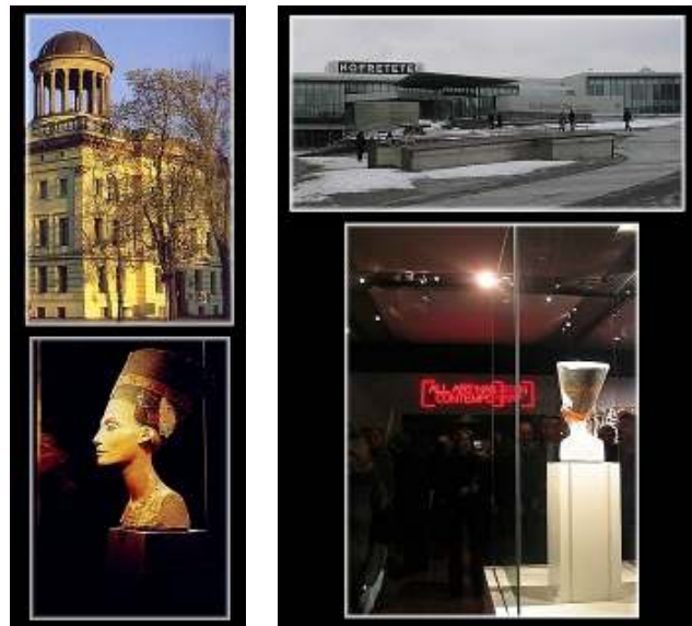
Abb. 8+9: Nofretete in Charlottenburg (links) und im Kulturforum (rechts)

Schloss Charlottenburg frei wurde und für die ägyptische Sammlung zur Verfügung gestellt werden konnte. Nach umfangreichen Umbau- und Renovierungsarbeiten fanden Hunderte von Objekten dort wieder ihren Platz.