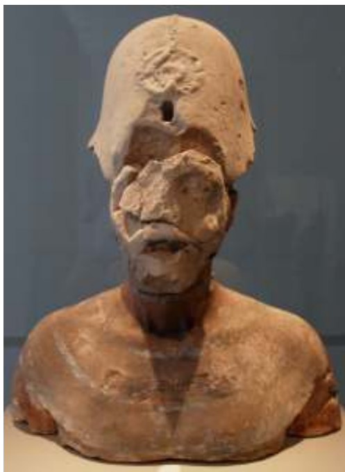
Abb. 4: Rekonstruierte Büste Echnatons

Die Werkstatt von Thutmose war die größte, die in Amarna gefunden wurde. Der Gebäudekomplex bestand im wesentlichen aus zwei Teilen. Im nördlichen Teil befand sich das Wohnhaus Thutmose mit seinen Nebengebäuden. Ein Teil des Hofes war abgeteilt für das Haus eines weiteren Bildhauers, Borchardt nennt ihn den „Werkmeister“. Im südlichen Teil des Komplexes lagen, um einen Hof gruppiert, „Gesellenwohnungen“. In den Höfen waren reichlich Abfälle der Steinmetzarbeiten verstreut. Auch große Abraumgruben fand man vor. In einer dieser Gruben kam auch das Ob-