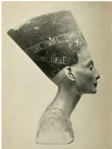
Abb. 7: Schäfers Veröffentlichung in „Kunstwerke aus el-Amarna“ I

und Fotos der Büste (Abb. 7). Dadurch wurde nicht nur ihre Existenz, von der in der Zwischenzeit ein größerer Personenkreis wusste, sondern auch – und das ist wohl ausschlaggebender – ihr Bild publik. Damit war der Damm gebrochen. Ab März 1924 wurde Nofretete im Neuen Museum der Öffentlichkeit präsentiert. Borchardts eigene Publikation „Porträts der Königin Nofretete“ erschien rechtzeitig vor Ausstellungsbeginn.